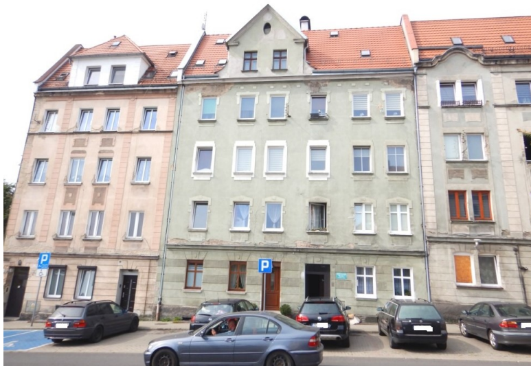
Ogólny widok budynku

na sprzedaż lokalu mieszkalnego Nr 12 znajdującego się w budynku położonym w Lubaniu przy ul. Stanisława Worcella 2 wraz z udziałem we współwłasności nieruchomości gruntowej (działka nr 29, AM 18, Obręb II o powierzchni 156 m 2 , JG1L/00016331/4)